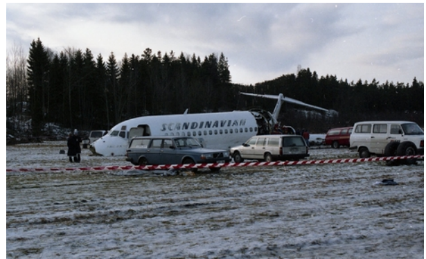
Dana Viking kort efter haveriet.