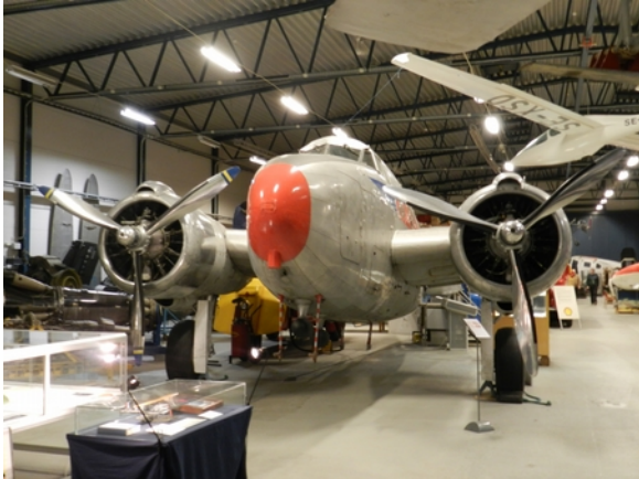
SE-BZE som hon ser ut idag.

Värt att notera är att SE-BZE har kunnat ses av miljoner tv-tittare. I samband med att det amerikanska tv-bolaget CNN intervjuade innovatören Håkan Lans, utgjorde SE-BZE blickfång under delar av intervjun. Utbildningsradion har filmat interiör- och exteriörscener för en dokumentär om den svenske diplomaten Raoul Wallenbergs resa till Budapest 1944.