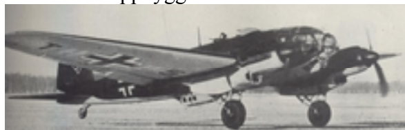
En Heinkel He 111H.