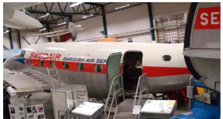
På Arlanda Flygsamlingar visas nu denna nyrestaurerade Lockheed Lodestar, byggd i Kalifornien 1943 och bland annat använd för distribution av kvällstidningen Expressen!

Arlanda Flygsamlingar kan besökas tisdagar och torsdagar då volontärerna arbetar med de olika planen av vilka det finns ett 40-tal. Man har också publika visningar första helgfria lördagen i varje månad. Samlingarna ligger vid Swedavias långtidsparkering, strax bortom Radisson Blu Arlandia Hotel. □