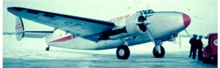
En bild från Bromma på det nyrestaurerade flygplanet när det var i tjänst. Lägga märke till tankbilen till höger i bild. Nu är SE-BZE åter i skick, som när det begav sig, för över 50 år sedan.