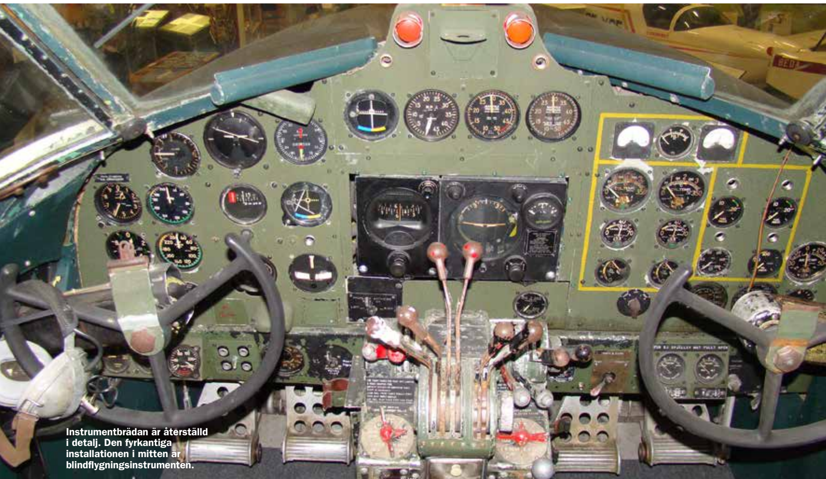
Instrumentbrädan är återställd i detalj. Den fyrkantiga installationen i mitten är blindflygningsinstrumenten.