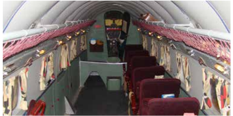
Kabinen i Lodestar visar hur passagerarkomforten var när Linjeflyg ägde flygplanet under en period i slutet av 1950-talet. Vingbalken gick rakt igenom kabinen.