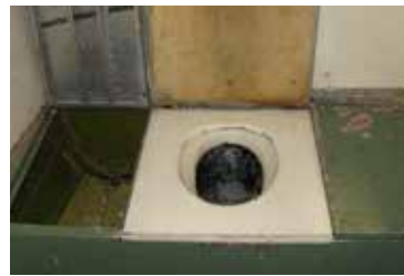
För passagerarnas bekvämlighet (?) var Lodestar även utrustad med en toalett. Avloppet mynnade dock inte, som på SJ:s tåg, ut i det fria ...